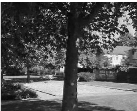
De oude jeu-de-boulebaan die is opgeruimd

Maar gelukkig is er voor de jeu-de-boule-liefhebbers een goed alternatief in de buurt. Op de binnenplaats van woonzorgcentrum Het Woolde aan de Geerdinksweg bevindt zich een prachtige jeu-de-boulebaan, opengesteld voor iedereen. Alle bewoners van de Woolder Es zijn van harte welkom om (gratis) van deze baan gebruik te maken. Je kunt er komen via de hoofdingang van het Woolde.