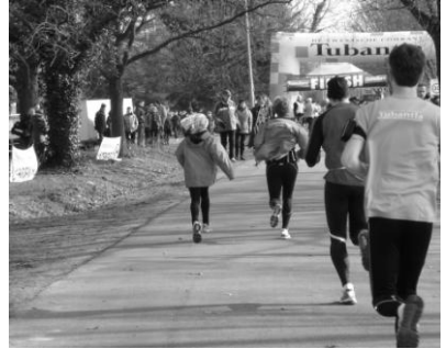
Lopers op weg naar de finish van de derde van de vier Wooldereslopen in 2011