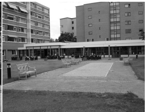
De nieuwe jeu-de-boulebaan op de binnenplaats van het Woolde, opengesteld voor iedereen