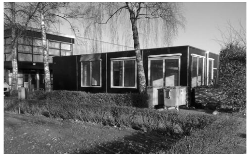
De vleugel bij het Twickelcollege waarin de Kardinaal Alfrinkschool en buitenschoolse opvang Dinges voorlopig gehuisvest zijn.