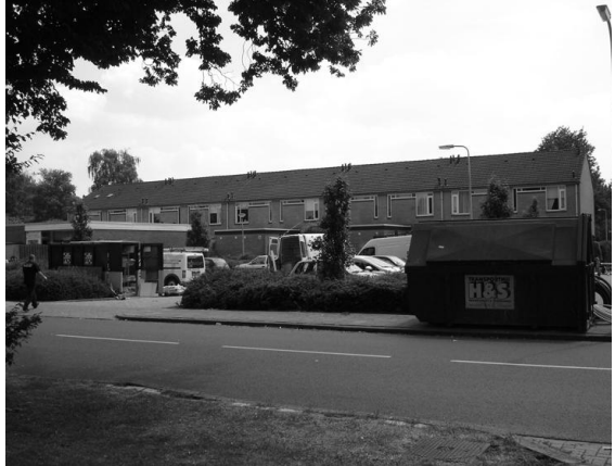
Er wordt hard gewerkt aan het onderhoud van de woningen van Welbions

wijkanalyse die de gemeente Hengelo in 2008 voor de Woolder Es heeft uitgevoerd. Omdat de gemeente zich daarbij heeft gericht op wijkbrede onderwerpen en Welbions zich hoofdzakelijk focust op het deel van de buurt waarin zich haar woningen bevinden, maakt dit een gedegen totaalaanpak van de Woolder Es mogelijk. De leefbaarheid van een buurt is iets dat door de bewoners van een buurt wordt ervaren. Daarom is het belangrijk om de ervaringen en meningen van de bewoners te betrekken. Welbions heeft daarom op woensdag 7 april een panelgesprek met bewoners uit de Woolder Es georganiseerd. Ook de gemeente en een medewerker van Carint waren hierbij aanwezig. De avond begon met een rondgang door de wijk (misschien heeft u op 7 april een groep mensen langs uw woning zien lopen). De deelnemers hadden van tevoren locaties in de wijk aangewezen die ze samen met de groep wilden bekijken. Tijdens het panelgesprek zijn de door de bewoners aangewezen