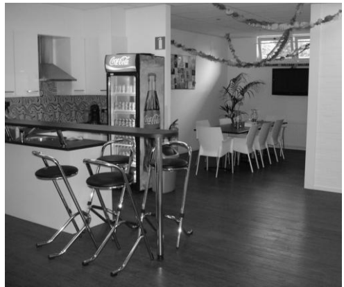
De vernieuwde hal van het buurthuis

Er is in dit blad al vaker op geweest: Buurthuis en Speeltuinenvereniging Weidedorp-Woolderes aan de Curaçaostraat 10 is er, zoals de naam ook aangeeft, ook voor onze buurt. Het buurthuis is de afgelopen tijd opgeknapt. De verschillende ruimten