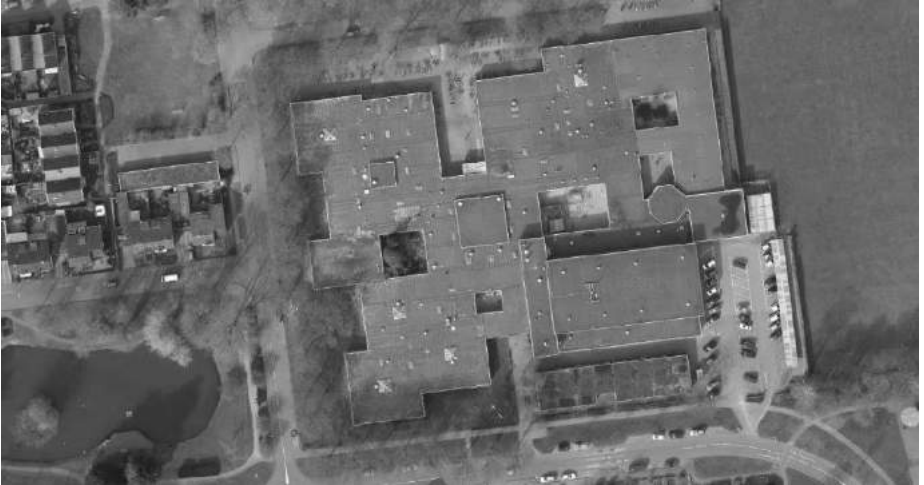
Luchtfoto van begin 2015 toen de oude school nog in gebruik was

Het mooi vernieuwde Twickelcollege is bijna klaar. In januari trekken de leerlingen en docenten er weer in. Wilt u weten of en wanneer er een open dag komt en wat het nieuwe gebouw voor onze buurt gaat betekenen, hou dan Nextdoor Woolder Es of www.woolder-es.nl de gaten.