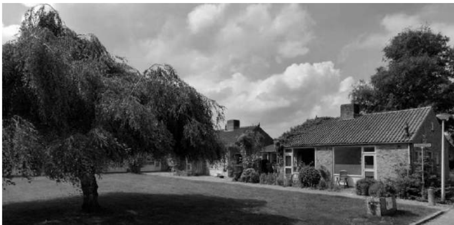
“Kabouterhuisjes” aan het Hyacintenpad

Vlak bij de Woolder Es is de Bloemenbuurt. Kent u daar de kabouterhuisjes? In één van die huisjes aan het Hyacintenpad 2 is sinds september is een nostalgisch minimuseum. De voormalige bejaardenwoning uit 1961 is volledig in de wederopbouwstijl van die tijd ingericht door museum Sfeer van Weleer uit Rekken. In september kwamen er ruim 500! bezoekers.