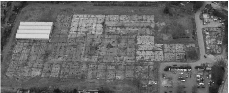
Luchtfoto van het Seahorsterrein, linksboven de 4 sheddaken

Zoals u misschien in de Tubantia hebt gelezen, worden er weer plannen gemaakt voor woningbouw op het Seahorsterrein. De vier sheddaken die de sloopwoede (op het industrieel erfgoed) hebben overleefd, blijven volgens het krantenartikel gelukkig in stand. Veel meer is er op dit moment nog niet bekend. Wilt u op de hoogte blijven van de ontwikkelingen, volg dan het nieuws op Nextdoor Woolder Es of op www.woolder-es.nl